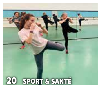
20 SPORT & SANTÉ