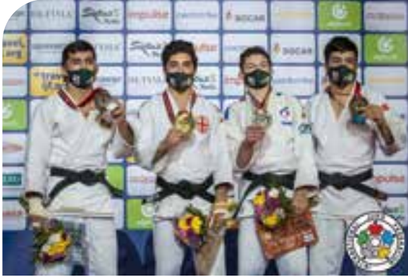
Bronze mondial La médaille du « c'est mieux que rien. »

Le Mag : Mais vous êtes parvenu à vous remobiliser ?