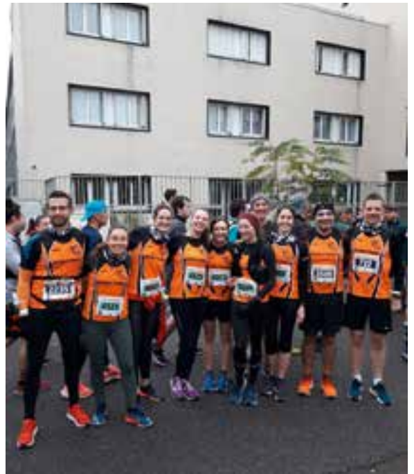
21 novembre - Semi-marathon de Boulogne- Billancourt 29 athlètes engagés.