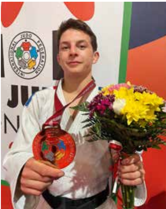
Bronze au Grand Slam de Paris La cerise sur le gâteau.