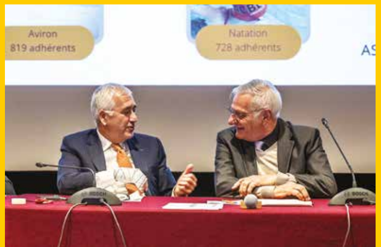
Pierre-Christophe Baguet, maire de Boulogne-Billancourt