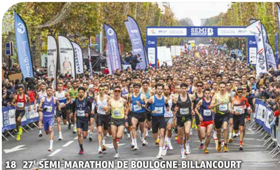
18 27 E SEMI-MARATHON DE BOULOGNE-BILLANCOURT